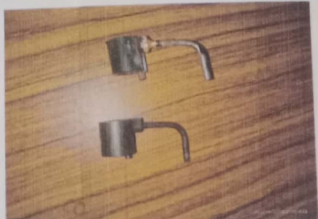
cooling orzle jet