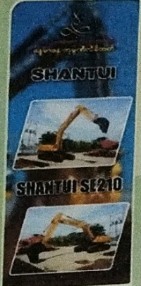
Vinyl design ပါရှင်