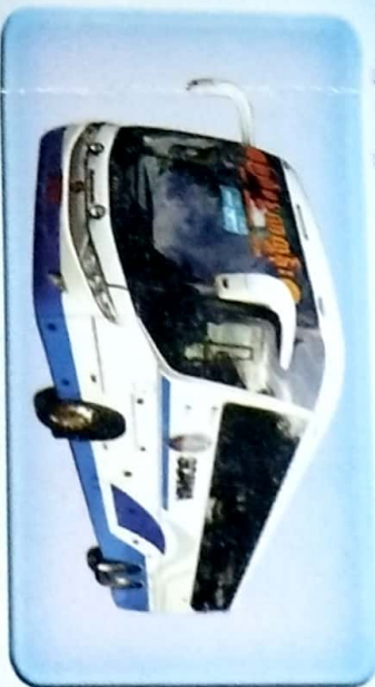
ယာဉ်ထွက်ချိန်ထက် မိနစ်(၃၀) ခေတ္တအရောက်ကြွပါရန်။

အမည် ..... ကိုဦးအိတ် နေ့စွဲ ..... ၁၀-၁၂-၁၄, Bus ..... Yan ယာဉ်ထွက်ချိန် (နံနက် - ..... ၄:၃၀ နာရီ) (ည - ..... နာရီ) ခုံအမှတ် ..... ၁၆ ကျသင့်ငွေ ..... ၂၅၀၀၀