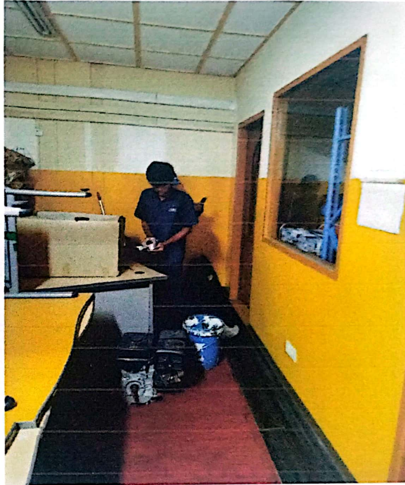
MAC BU မှ MKT အခန်းတံခါးသော့မကောင်းပါသဖြင့် HO GAB အဖွဲ့မှလာရောက်ပျံ့ပိုင်ပါသည်