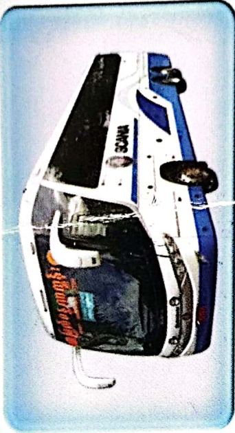
ယာဉ်ထွက်ချိန်ထက် မိနစ်(၃၀) စော၍အရောက်ကြွပါရန်။

အဆင့်မြင့်အားသည့်ပို့ဆောင်ရေး မန္တလေး ➡ နေပြည်တော် ➡ စစ်ကိုင်း ➡ မြစ်ကြီးနား ➡ ယသီ ➡ မြောင်းမြ ➡ မိုးကုတ် ➡ မော်လမြိုင် ➡ တားလယ် ➡ ကော့သောင်း ➡ မြိတ် ပြင်ဦးလွင် ➡ လှော်စိုက် ➡ မုဆယ် ➡ ဖောင်းကြီး ➡ ကျိုင်းတုံ ➡ စာချိုလိပ်