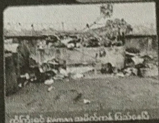
အမှိုက်ပစ်ခံ မာဂျီဂေဟီ