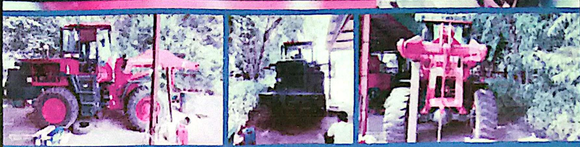
ML30(3118) Painting ပြီးစီးတဲ့အခြေအနေပါခင်ဗျ။