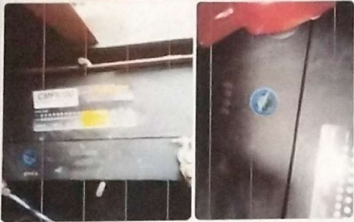
Red Star Ricemill Matador 200KVA Battery 2units ပုံတောင်း ထားတာပါ 11:09 AM

စက်ကနိုးမရပါဘူးနိုးတာနဲ့ Emergency stop alarm ပေါ်နေပါ တယ်တဲ့ခင်ဗျာ 11:10 AM