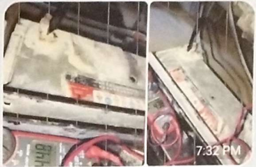
battery လဲအားမရှိပါဖူးခင်ဗျာ 7:32 PM

Taungoo ရုံးကနေလည်လောက် မှ service လာမယ်ပြောပါတယ်ခု ကတောင်ပေါ်ဘက်မှာ Harvester လုပ်နေလို့ပါတဲ့ခင်ဗျာ meterလည်းမ ရှိပါဘူးတဲ့ဘက်ထရီတိုင်းခိုင်းဖို့က 11:12 AM