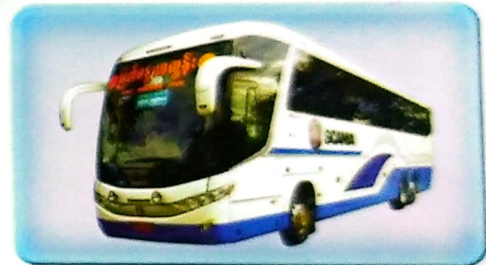
ယာဉ်ထွက်ချိန်ထက် မိနစ်(၃၀) စော၍အရောက်ကြပါရန်။