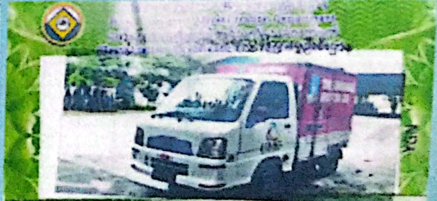
Plate No 4G/3290 Model Year 2005 Make & Model SUZUKI/SABO #8 Vehicle Type VAN (4X2) Location V2