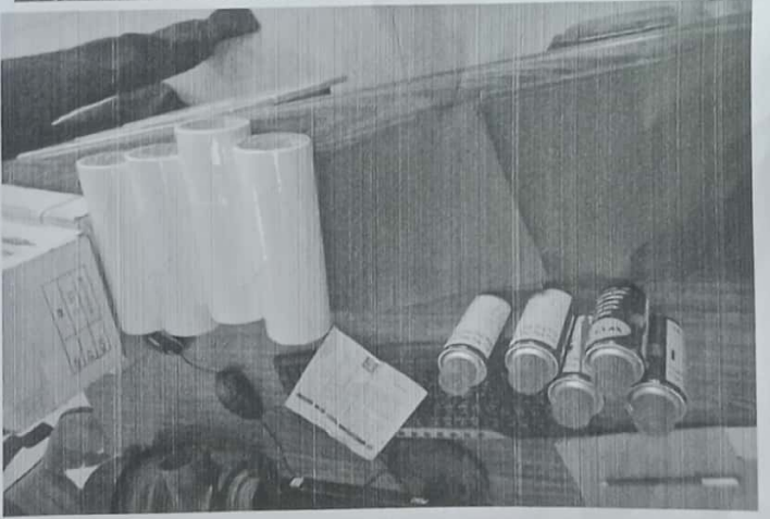
Workshop used ဝန်ထုပ်ပေးခံရခြင်း