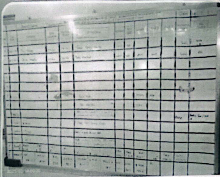
Old Job Board