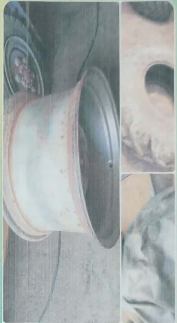
15,000 တာယာ၊ကျွတ်အသစ်ဝယ် ရန်လို