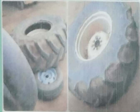
55,000 ကျွတ်နှစ်ပေါက်ဖာ၊ တာယာ တစ်ပေါက်ဖာ