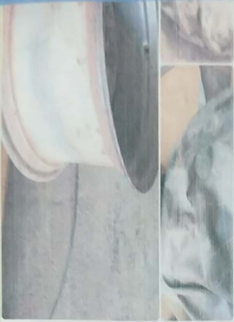
15,000 တာယာ၊ကျွတ်အသစ်ဝယ် ရန်လို