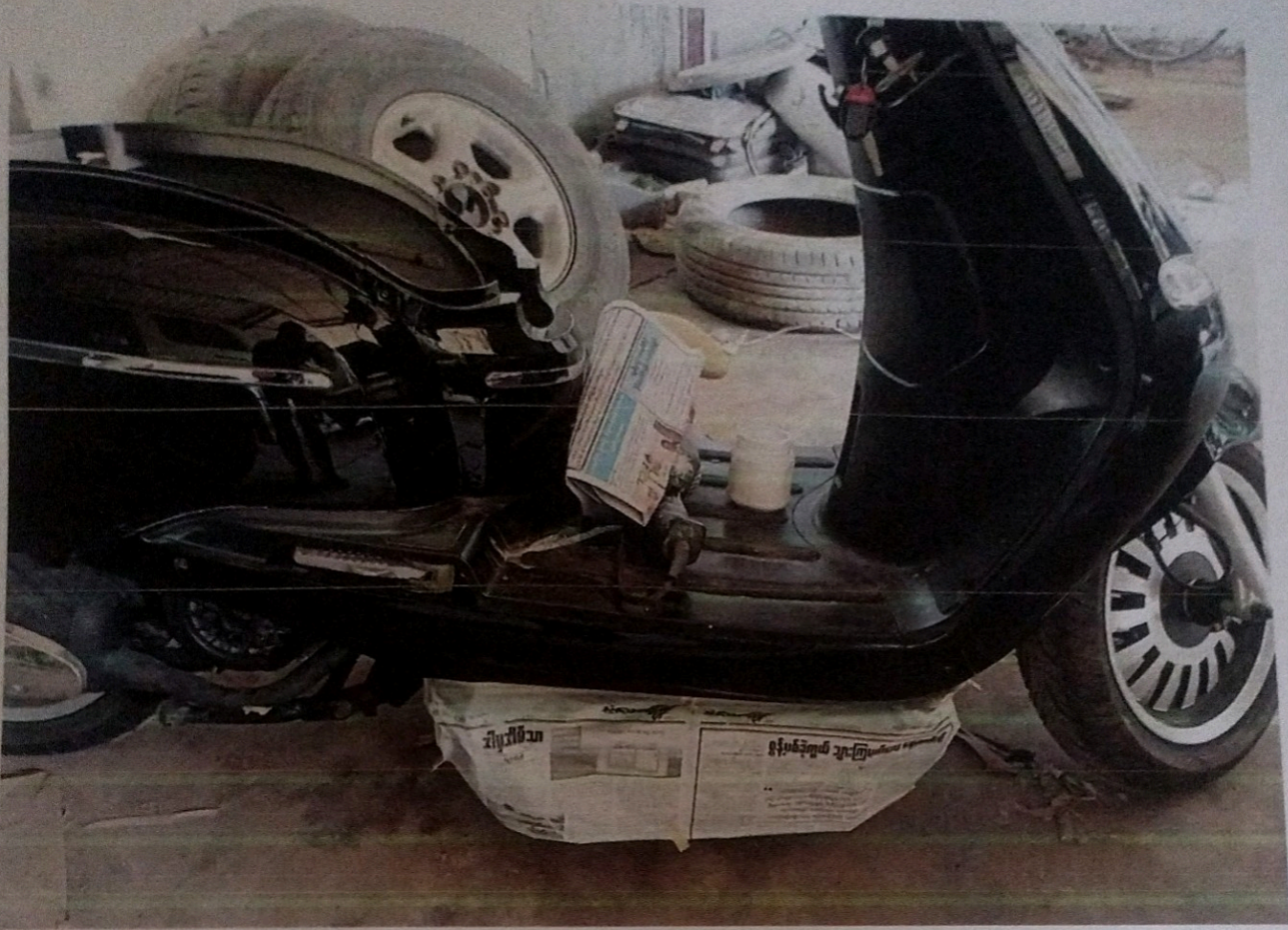
On processing (00125)