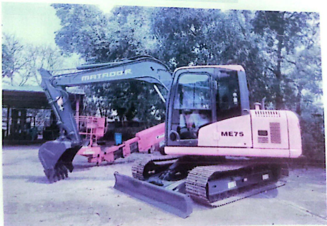
After Painting Conditions