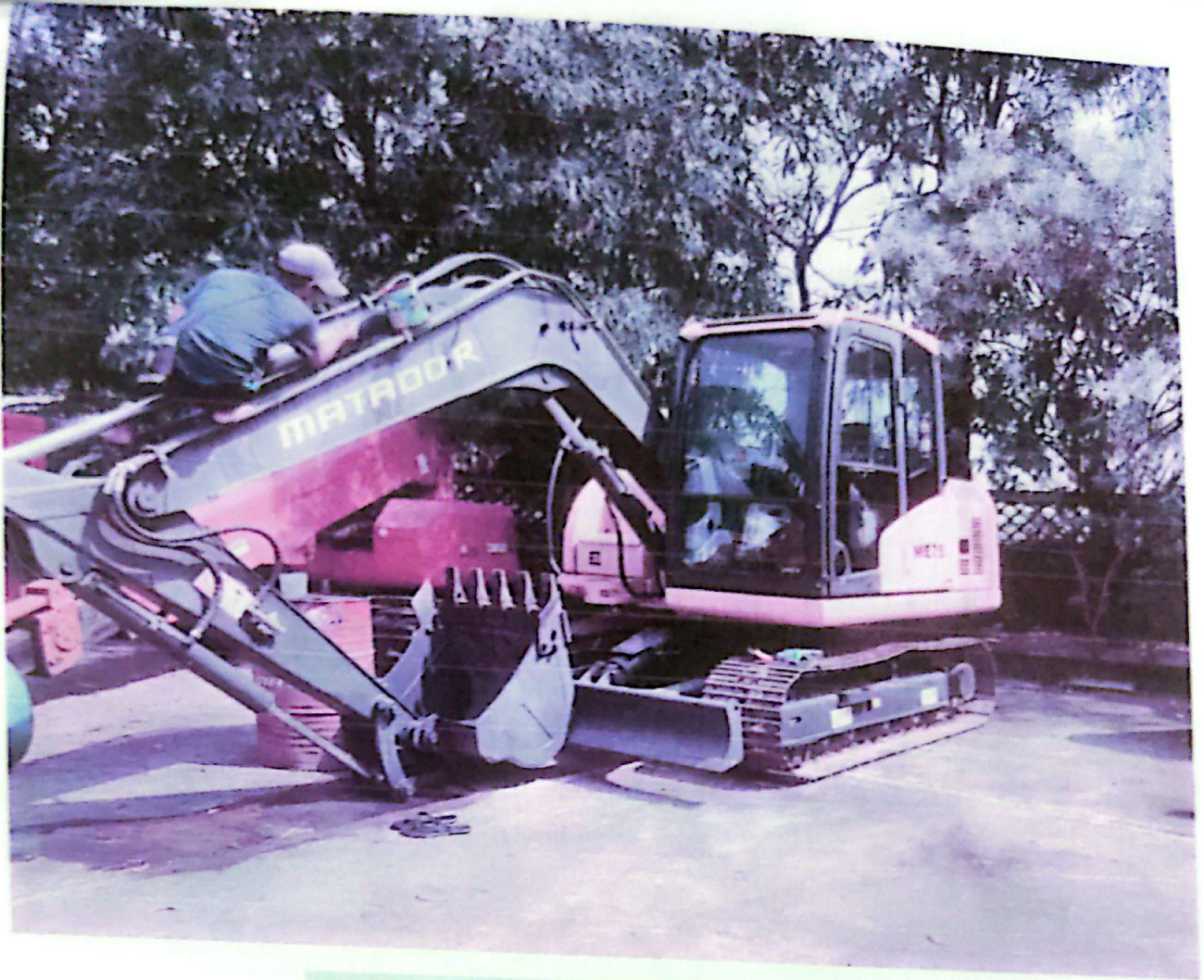
Before Painting Conditions