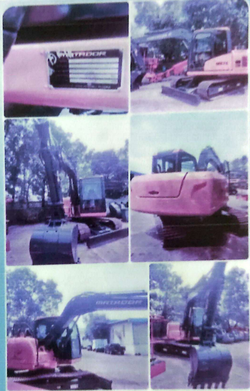
ME75(1304) Painting လုပ်ပြီးသွား တဲ့ Condition ရှိရင်

Pinned Message -Starter motor -Battery 2pcs -Engine oil sensor -Cr... 11:37 AM