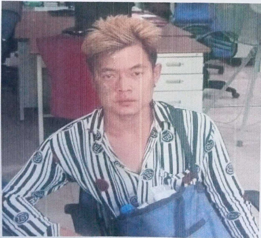
ဒာမာလေးသူ