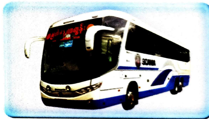
ယာဉ်ထွက်ချိန်ထက် မိနစ်(၃၀) စော၍အရောက်ကြပါရန်။