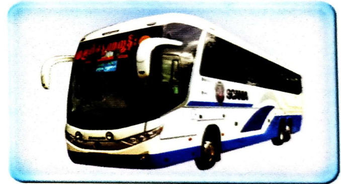
ယာဉ်ထွက်ချိန်ထက် မိနစ်(၃၀) စော၍အရောက်ကြွပါရန်။